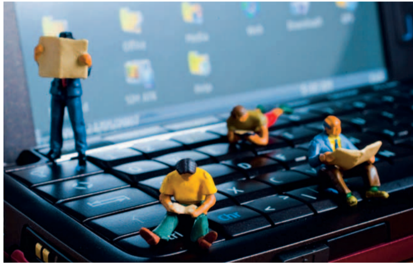
Abbildung) mit insgesamt 16 Präsenztagen.

Fünf Module. Die Projektpartner sind zunächst von einem „Ressourcenpool Unternehmen“ ausgegangen: Welche Kompetenzen sollten in einem Unternehmen vorhanden sein, um sich in der Kontraktlogistik erfolgreich engagieren und langfristig etablieren zu können? Daraus mussten die Kompetenzen identifiziert werden, über die